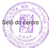
Selo do centro